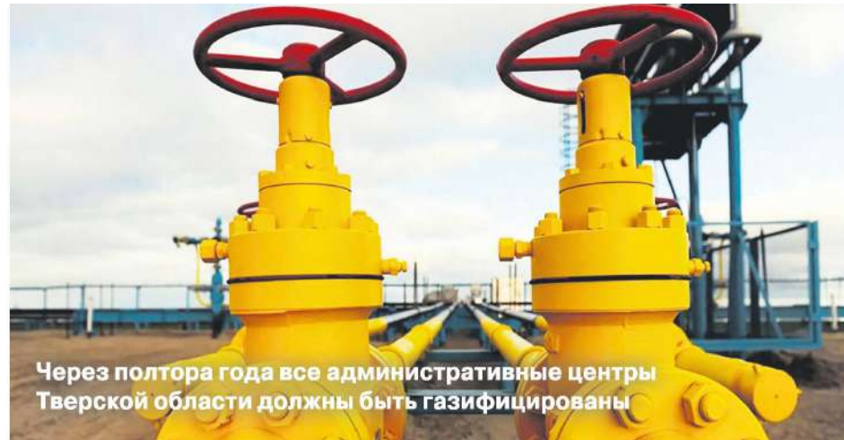
Через полтора года все административные центры Тверской области должны быть газифицированы